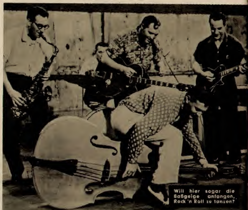
Will hier sogar die Baßgeige anfangen, Rock'n Roll zu tanzen?

Heiß — heißer — am heißesten! Auf die Stühle, Fans!